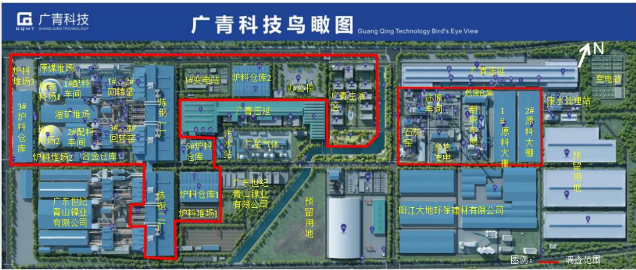
图 1.3-1 调查范围示意图

广东广青金属科技有限公司地块总调查面积 103 万平方米，位于阳江市高新技术产业开发园区临港工业园海港二横路 1 号，主要由一个镍合金生产厂、两个不锈钢炼钢厂，后建一套还原炉系统及配套设施（合金热送项目）等组成。公司地址东侧为维达护理用品（广东）有限公司；北侧为公路，公路北接中国物流（华南诚通物流有限公司）、广东粤水电新能源装备有限公司、中国水电四局阳江海工装备制造基地；西侧紧邻入海港；南面为临海港口同时接壤广东世纪青山镍业有限公司、阳江翌川金属科技有限公司、阳江市大地环保建材有限公司；同时红线范围内部分地块为租赁用地及未投产项目。周边为天园围村、新生村、新丰村、牛马围村，以红线为界 2km 内居民及相关敏感人群已完成搬迁。本次调查范围见图 1.3-1。